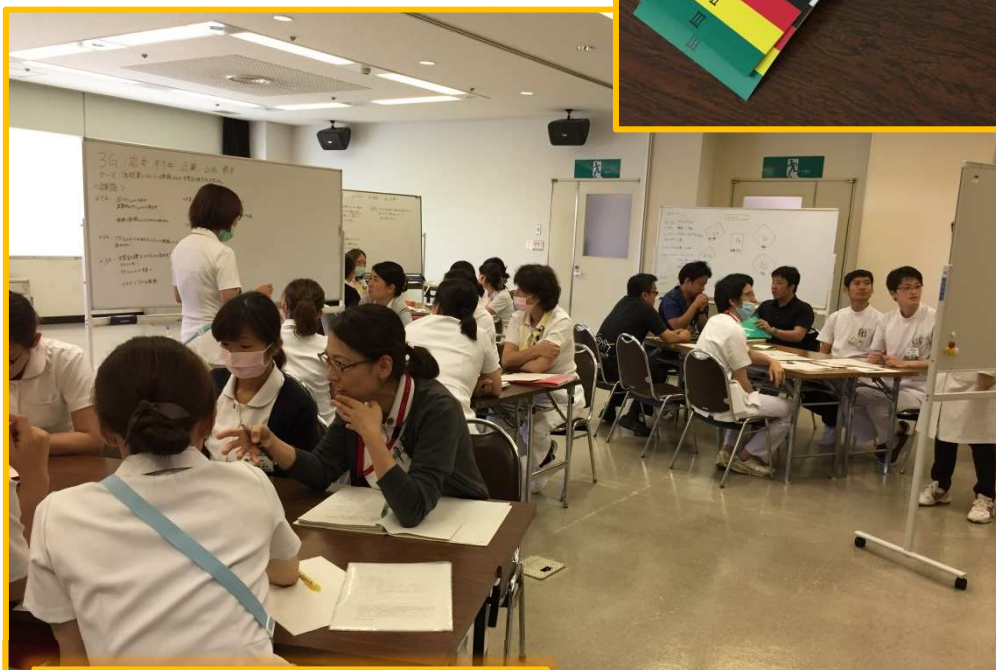
各グループでホワイトボードを使い板書しながら討議しています